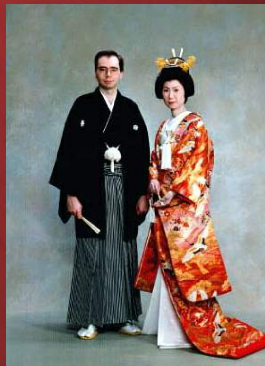
Жених и невеста в традиционных японских нарядах

По древней традиции, больше всего браков в Японии заключается летом, в кругу самых близких родственников.