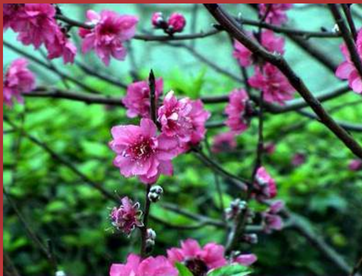
Ветвь расцветающего персика - символ вьетнамского Нового года

Отмечается между 21 января и 19 февраля, точная дата меняется из года в год.